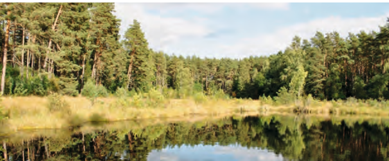
Moorsee im Teufelsbruch

Der Naturpark Stechlin-Ruppiner Land ist ein herrliches Wanderrevier. Auch in diesem Sommer bietet die NEB ein Tourenhighlight an: Im Juli und August fährt die Regionalbahn RB54 immer samstags und sonntags vom Bahnhof Rheinsberg (Mark) zum Bahnhof Stechlinsee mitten im Naturschutzgebiet Stechlin und verlängert damit ihre Strecke. Jahrzehntlang waren der zehn Kilometer lange Abschnitt und der Bahnhof streng geheim. Denn auf der Landzunge zwischen Stechlin- und Nehmitzsee wurde in den 1960er Jahren das Kernkraftwerk Rheinsberg errichtet. Seit 1995 wird es zurückgebaut. Die Natur ringsum konnte sich ungestört entfalten. Im Sommer laden die schattigen Wälder zur erholsamen Tour und die klaren Seen zum erfrischenden Baden ein.