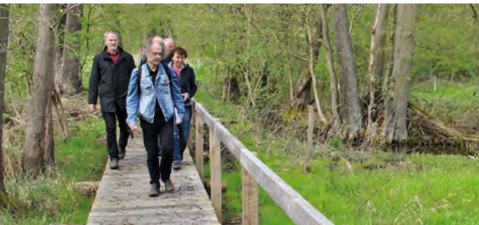
Bohlensteg am Südufer des Wittwesees